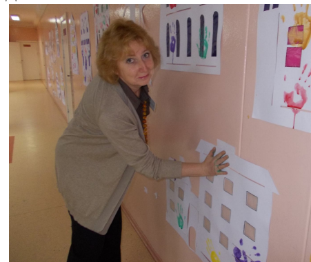
Цветы толерантности, выполненные учащимися других школ г.Клайпеды под руководством педагогов школы Гедмину. Один из таких цветов привезен в качестве подарка от учащихся Литвы Гимназии №67.