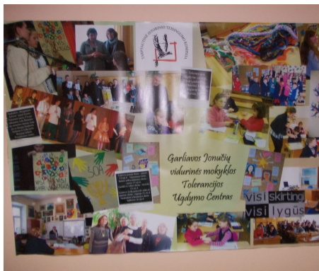
Участие в акции «Мы разные, но мы вместе!»