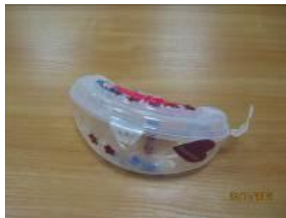
Поделки от учащихся 2 «Б» класса, классный руководитель Л.Я.Шипчинская