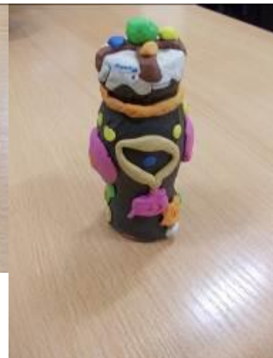
Поделки от учащихся 4 «Б» класса, классный руководитель Н.Э.Ивасько