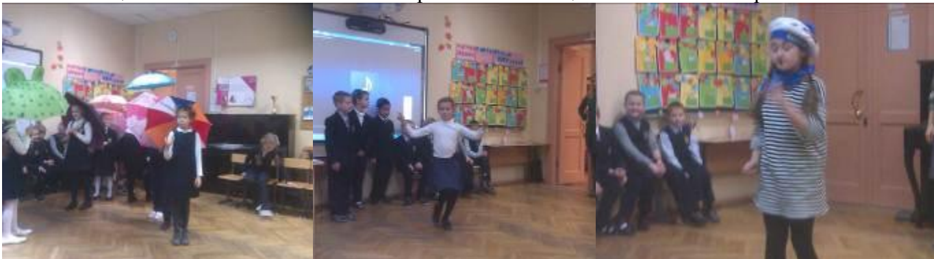
Учащиеся подготовили для своих мам стихи и песни о маме