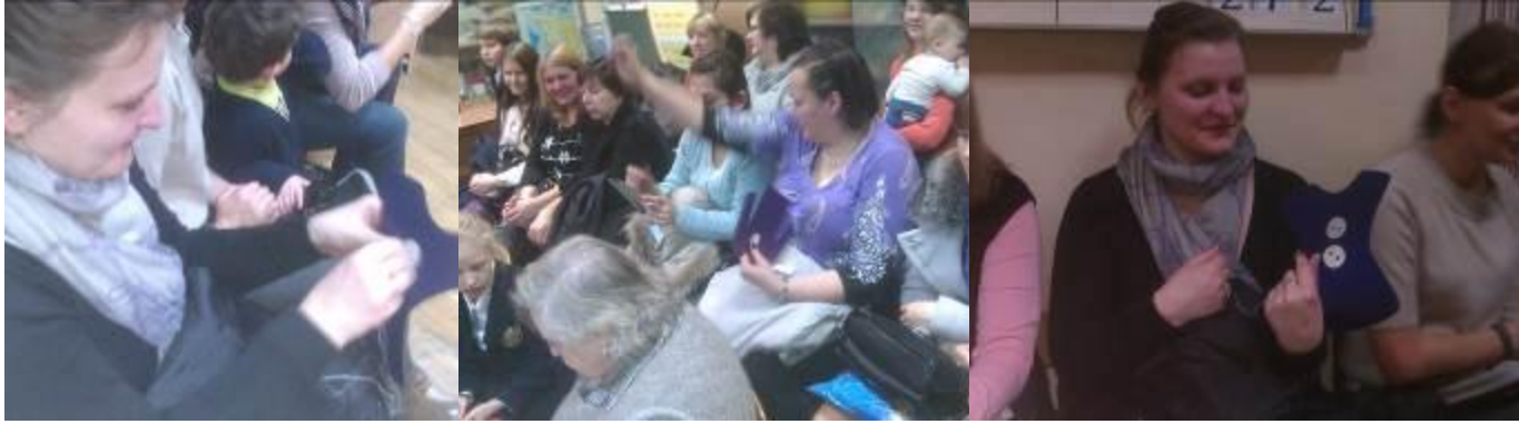
Заранее проведенный конкурс среди мам учащихся «Мамино увлечение»