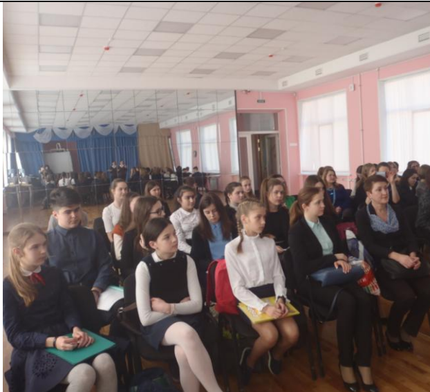
Секция «Посредством слова творю я мир» начала работу в актовом зале