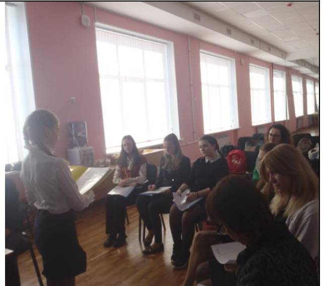
Работа подсекции «Фольклор, классика и современность»