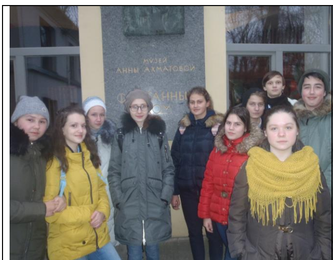
Памятная фотография перед входом в Фонтанный дом