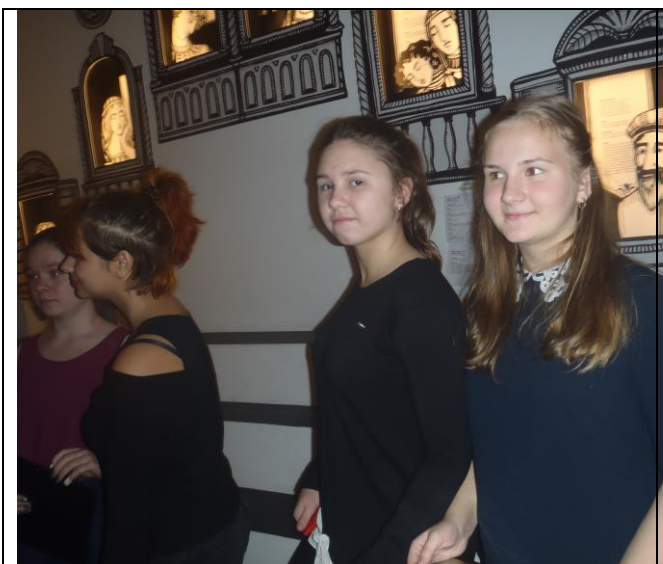
На площади Вероны