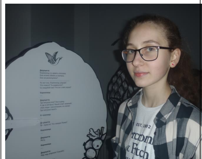
Сад дома Капулетти