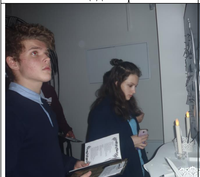
Размышления в склепе