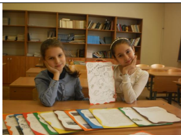
Лингвистические игры в 5а, б классах