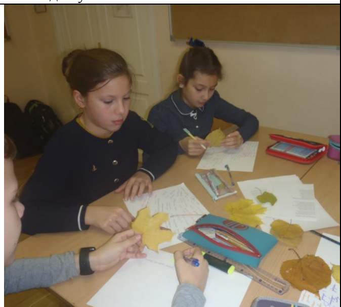
Мастерская творческого письма в 5 в классе