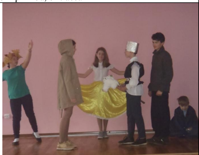
Литературный журнал «Песнь о вещем Олеге» в истории, литературе, драматизации Постановка учащихся 6б класса для учеников 5в класса