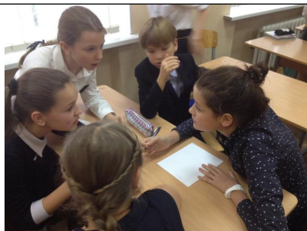
Игра по пьесе Д. Фонвизина «Недоросль» в 8б классе